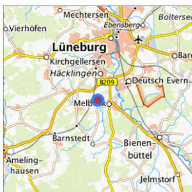
Lage in der gesuchten Region