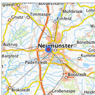
Lage in der gesuchten Region