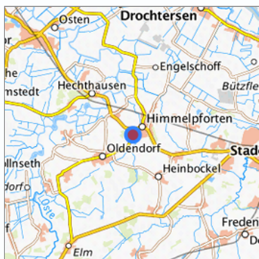
Lage in der gesuchten Region