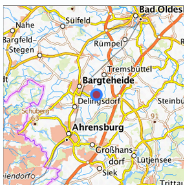
Lage in der gesuchten Region