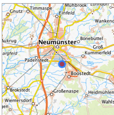
Lage in der gesuchten Region