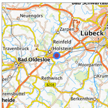
Lage in der gesuchten Region