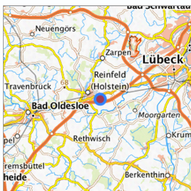
Lage in der gesuchten Region