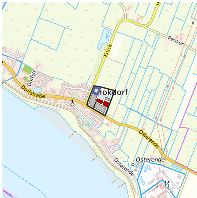
Detaildarstellung der gesuchten Gewerbefläche