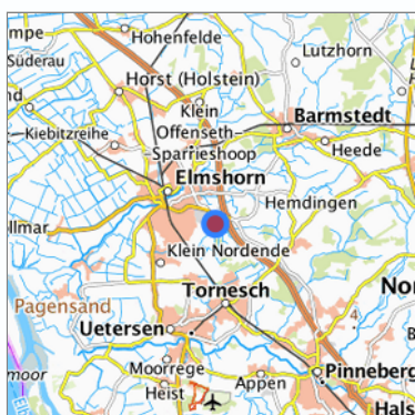
Lage in der gesuchten Region