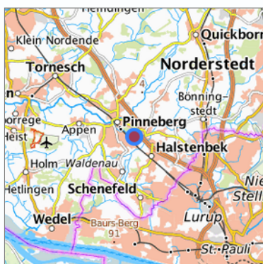
Lage in der gesuchten Region