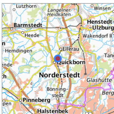
Lage in der gesuchten Region