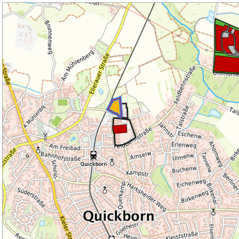
Detaildarstellung der gesuchten Gewerbefläche